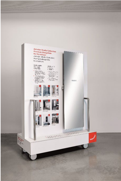
Bildquelle: Zehnder Group Deutschland GmbH, Lahr. Abdruck honorarfrei bitte unter Quellenangabe.

Motiv 8a+b: Den fünf Pop-ups im Markenerlebnisraum sind insgesamt sieben kompakte „Sidecars“ zugeordnet, die eine Vertiefung mit detailreichen technischen Exponaten bieten.