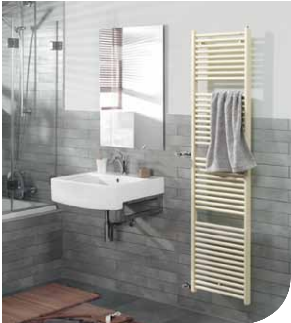
Zehnder Toga Austausch