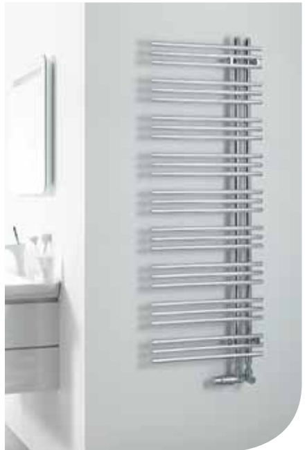
Zehnder Yucca Asymmetrisch